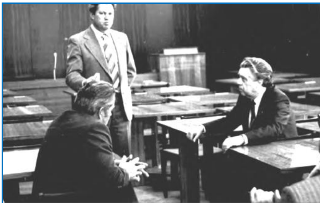
Фото 11 - Зал Ученого Совета РМИ. Обсуждение вопросов подготовки врачебных кадров для практического здравоохранения (в центре - ректор И.Н. Денисов, справа - министр здравоохранения РСФСР Н.Т. Трубилин) (Рязань, 1985)