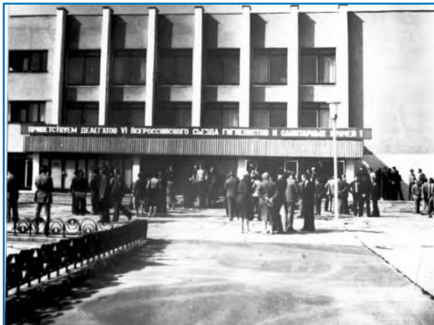
Фото 3 - Открытие и основные заседания VI Всероссийского съезда гигиенистов и санитарных врачей проходили во Дворце нефтяников ((Рязань, 2-5 июля 1985 г.)