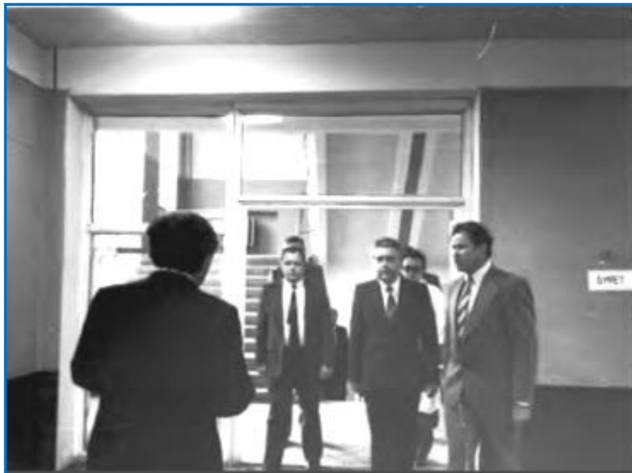
Фото 6 - 2-й этаж санитарно-гигиенического корпуса РМИ. Проф. П.Г. Ткачев встречает делегацию во главе с министром здравоохранения РСФСР Н.Т. Трубилиным и ректором РМИ И.Н. Денисовым (Рязань, 2-5 июля 1985 г.)