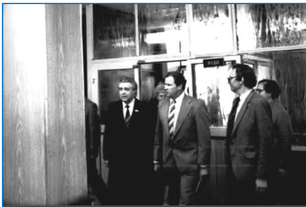
Фото 4 - В период работы VI Всероссийского съезда гигиенистов и санитарных врачей Министр здравоохранения РСФСР Н.Т. Трубилин посетил РМИ. Ректор проф. И.Н. Денисов и министр Н.Т. Трубилин в фойе санитарно-гигиенического (медико-профилактического) корпуса РМИ (Рязань, 2-5 июля 1985 г.)