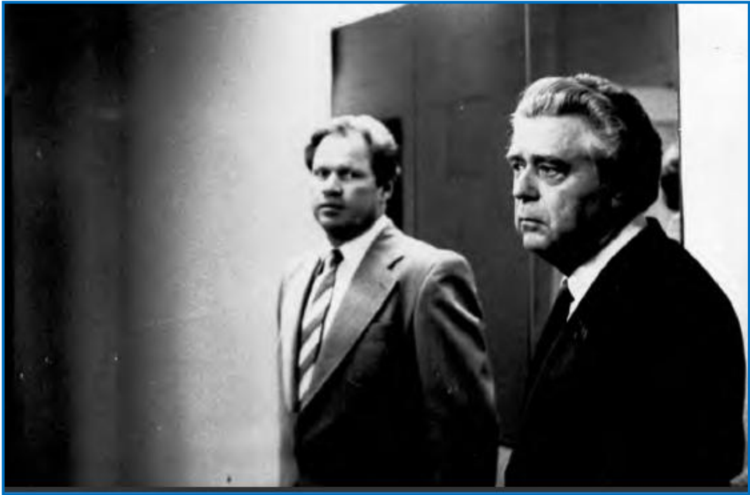
Фото 5 - Ректор РМИ И.Н. Денисов и министр здравоохранения РСФСР Н.Т. Трубилин (Рязань, 2-5 июля 1985 г.)