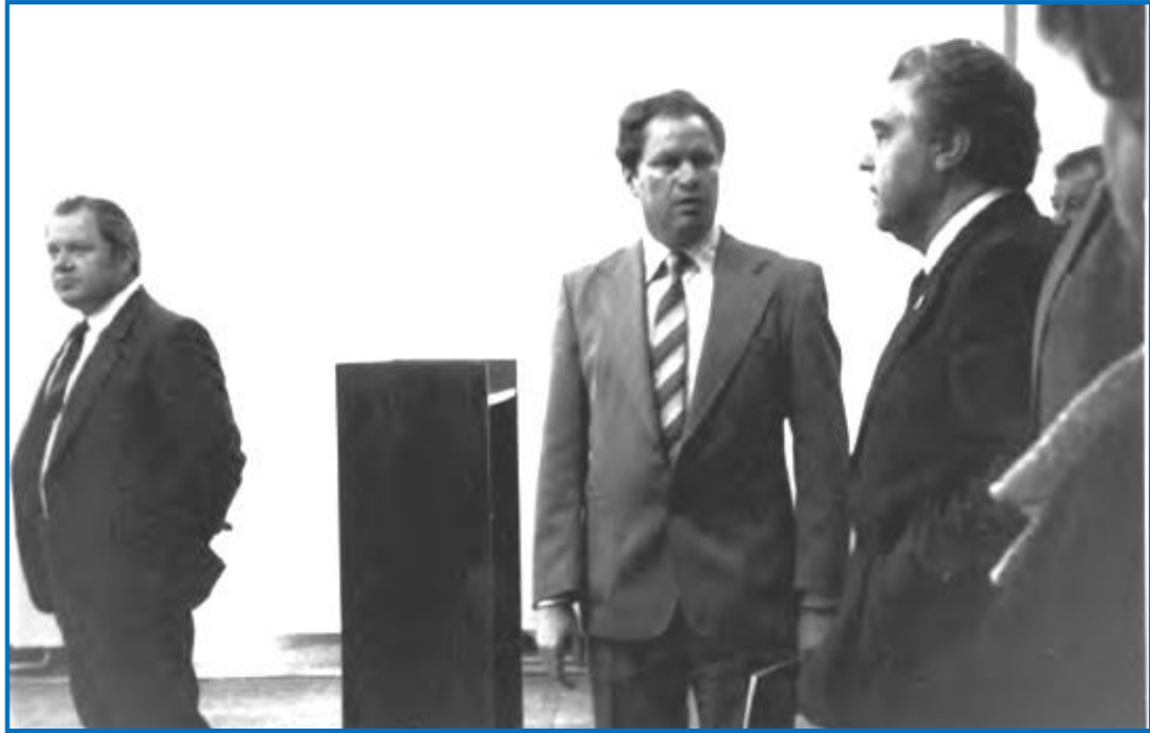
Фото 9 - VI Всероссийский съезд гигиенистов и санитарных врачей. Ректор РМИ И.Н. Денисов и министр здравоохранения РСФСР Н.Т. Трубилин на кафедрах ВУЗа (Рязань, 2-5 июля 1985 г.)